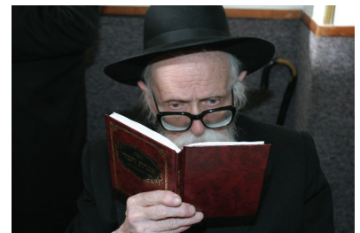
בעל 'ציץ אליעזר' זצ"ל

וכתב רבינו: שני פוסל גם בחולין שאין טבולין לתרומה (ואולי כונתו שהשני יעשה שלישי, וג"ז אינו נכון, דכל שאין ודאו מטמא חולין ל"ג על חולין הטבולין לחלה כמ"ש בנדה ז' א' וכ"פ הרמב"ם).